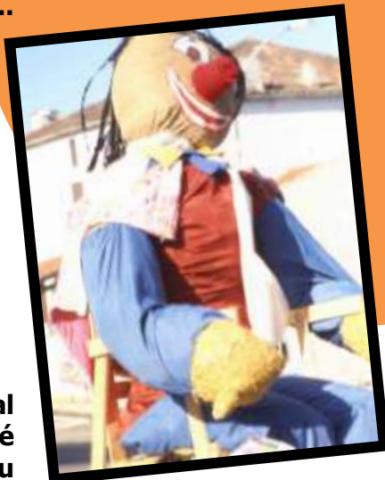
Monsieur Carnaval avant d'être brûlé sur le parvis du Foyer Rural...