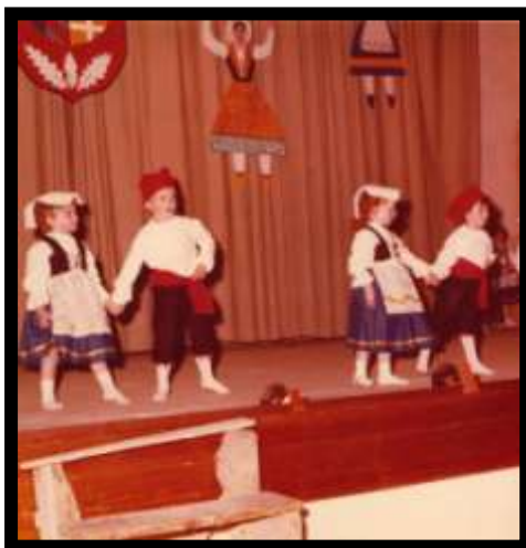
Fête des Ecoles ...