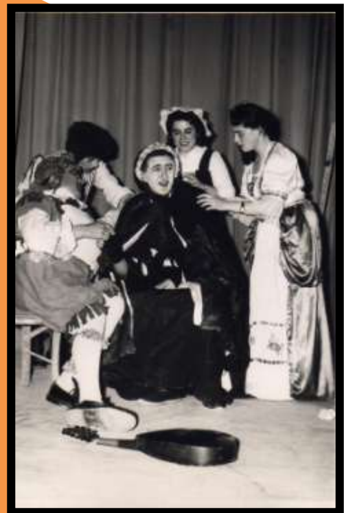
Représentation de la Section Théâtre de l'Amicale Laïque