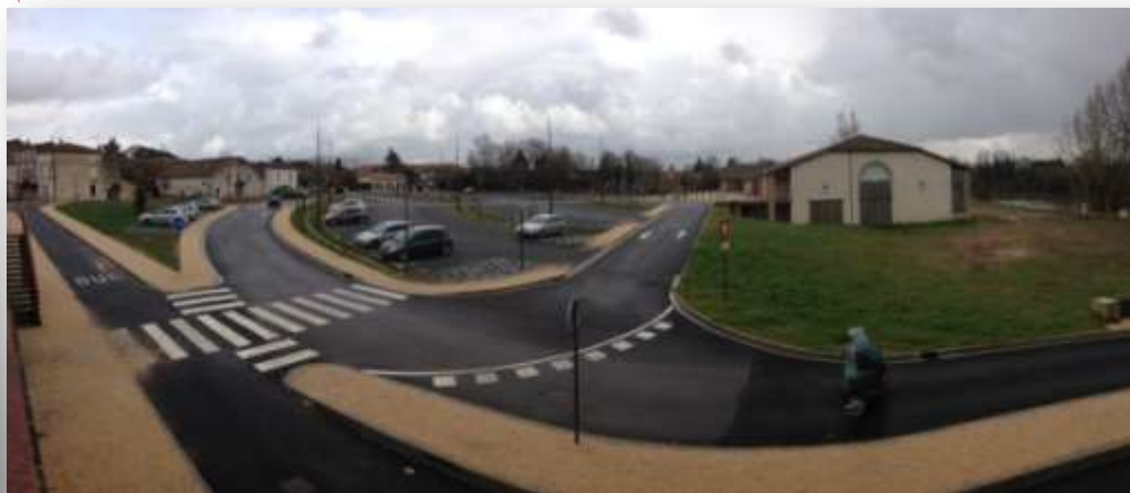
Parking de l'Espace Multifonctionnel