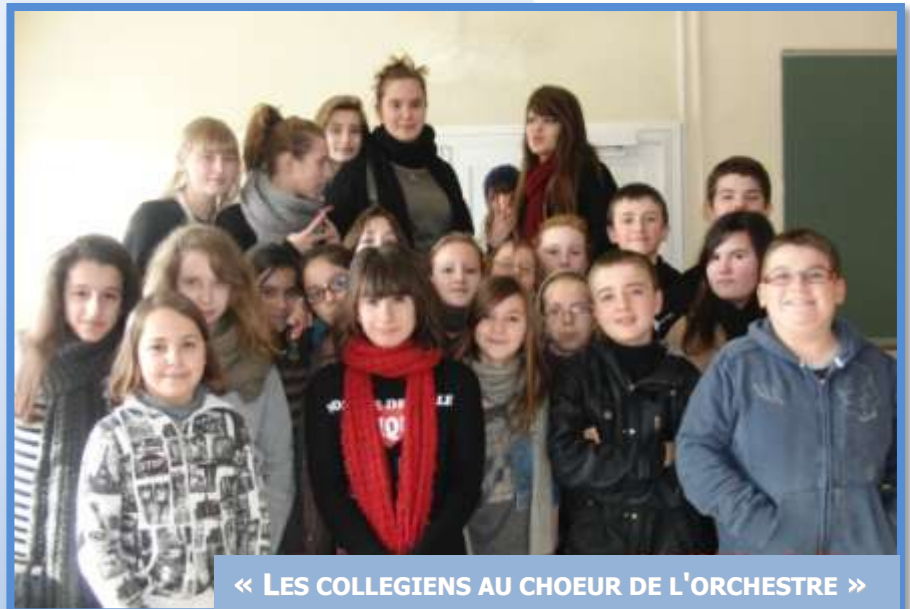
« LES COLLEGIENS AU CHOEUR DE L'ORCHESTRE »

Les familles des élèves impliqués, mais aussi tous les Lot-et-Garonnais, pourront assister en mai prochain à 3 concerts symphoniques à des tarifs très attractifs.