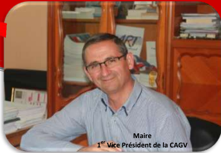
Maire 1 er Vice Président de la CAGV

Chères Casseneuilloises, Chers Casseneuillois,